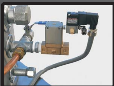
Valvola scarico automatico