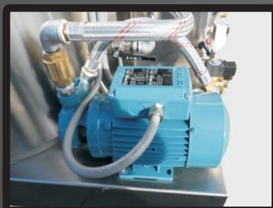
Pompa di alimentazione