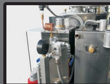
Strumentazione di controllo